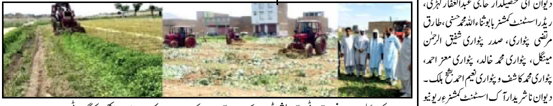
.....کوئٹہ بلوچستان فوڈ اتھارٹی نا آپریشن ٹیم سی پیک روڈ آ سیورٹی ناڈیراٹ سوک سوزی سے جس کننگ اٹی ء

اسلام آباد (اسے بی بی) جنجانی وزیر پار جلم کمال خان کراچی نی قومی اسمبلی نا ہاسک میر ایجاز خان جھرنی نا ارنانا ہوا نا مار میر زاہد خان جھرنی نا کریت ڈیکمپانی و دست سونی نا ودرشانی ء کرے۔ سے شیبے ناڈے جاری بیان نارداٹ جنجانی وزیر ایماندار نا بخشش کن دعا جاتا کرے ء دعا کرے کہ اللہ تعالیٰ ایماندار ء جنت الفردوس اٹی جاگ و بزرگو ہند