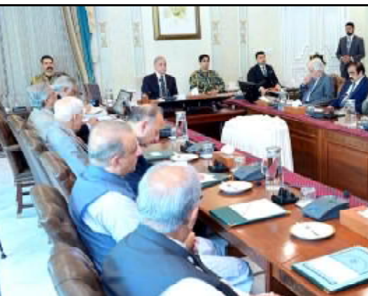
..... اسلام آباد وزیر اعظم شہباز شریف، چغائی کابینہ دیوان ناکاشی ء کنگے اٹ ء

اسلام آباد (اے پی پی) صدر منگل آصف علی زرداری زیارت اٹی پولیس چوکی آفرخوارج نا دہشت گرد جلیو ناخت اگلاوڑ تے ٹی مذمت ء کرسا واقفہ تینا جان تے غدر کروک پولیس آفسر وکارندہ غانا بہت فرخ شای ء فرخج تھسن چش کرینے۔ سے شہیہ نادے اٹی ایوان صدر پریس وگ ناروات صدر منگلت پارے ک بلوچستان اٹی امن و ایمنی نابرخلاف