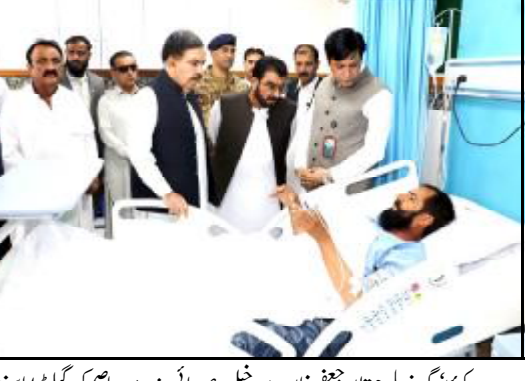
..... کوئٹہ گورنر بلوچستان چغمان مندوخل وصوبائی وزیر میر عاصم کوگیوٹا امینٹر اٹ ہندو ڈک جلیو اٹ شھی مروک آتا چا پترسی ء کنگے اٹ ء

پانزدہ دے ٹی رجسٹر مروک آ حاجی تاکچ دوہم لکھ آن گدرینگا اسلام آباد (اے پی پی) وزارت مذہبی باعادت بروک آریسہ بامات پارینے کن پانزدہ دے اٹی رجسٹر مروک حاجی تاکچ دوہم لکھ آن گدرینگا نے، اشارہ تے نیٹھل آئی ٹی بورڈ انا تیار کروک تذکر آ دے 12 ہزار 880 حاجی تینا آرائی تو لوک چ رجسٹریشن ء پورہ کریہ سے شہیہ نادے وزارت مذہبی باعادت نا ترجمان عربت ناروات چچ پوسٹل ہاوسٹل ایپ "پاک ج" اٹا مکف اٹ رجسٹریشن نا عمل مجاز آسانی اٹ متنگ کیہ۔ دا دوہم لکھ آن گدرینگا نے، اشارہ تے نیٹھل آئی ٹی بورڈ انا تیار کروک تذکر آ دے 12 ہزار 880 حاجی تینا آرائی تو لوک چ رجسٹریشن ء پورہ کریہ سے شہیہ نادے وزارت مذہبی باعادت نا ترجمان عربت ناروات چچ پوسٹل ہاوسٹل ایپ "پاک ج" اٹا مکف اٹ رجسٹریشن نا عمل مجاز آسانی اٹ متنگ کیہ۔ دا