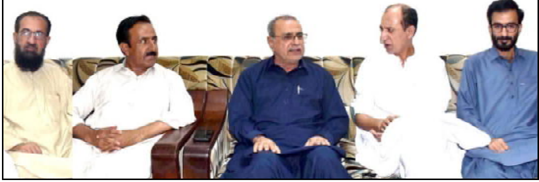
.....کوئٹہ سینیئر جان بلیڈی پریس کلب اسٹینڈر سٹائی رشید بلوچ بی بوئے نا سیکریٹری جنرل حسین ترین و لیتو ب شاہوانی تون اوڑدی کننگ اٹی ء