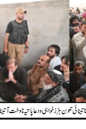
..... زیارت وزیر اعلیٰ بلوچستان میر سرفراز گئی زیارت ناشہید آتیا تینا ناخت آتیا حوال آتار شانی ء کنگے اٹی ء

نارپرت ء پورسا جہانی کاندو پاش خلاف ورزی ء کرینے۔ چغائی وزیر خوارکی و شینکاری عطا اللہ تارٹا پارینے کسندھ طاس معاہدہ نا معطل آن بھارت ء شھی منگ آن بیدر چچ اس دوہو۔ او پارے کہ معاہدہ نارو اٹ دیر پاکستان ناروا اٹا حق ء بھارت نا چندی گام گچ آتا چچ اخلاقی یکانوئی کنگ جوڑ مک۔ وزیر دفاع خولجہ آصف ہیدر موقف تینا ٹی کرسا پارے کہ پاکستان ہرنہاڈا سندھ طاس معاہدہ نارکھ ء او پارے کہ چندی گام گچ آتا چچ جاگہ غاندھ طاس معاہدہ ناپورہ عملدرآمد عالمی ء۔ او پارے کہ بھارت اسیجائی اٹی ویلہ غانتیا ہیدر جاری ناصول آتیاں ناامنگ اٹی ء۔