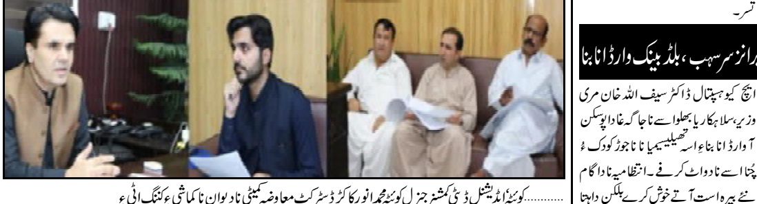
.....کوئٹہ ایڈیشنل ڈپٹی کمشنر جنرل کوئٹہ نورا کوز ڈسٹرکٹ معاوضہ کمیشن نا دیوان نا کماشی ء کننگ اٹی ء