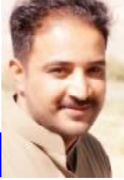
..... پروفیسر حسن ناصر