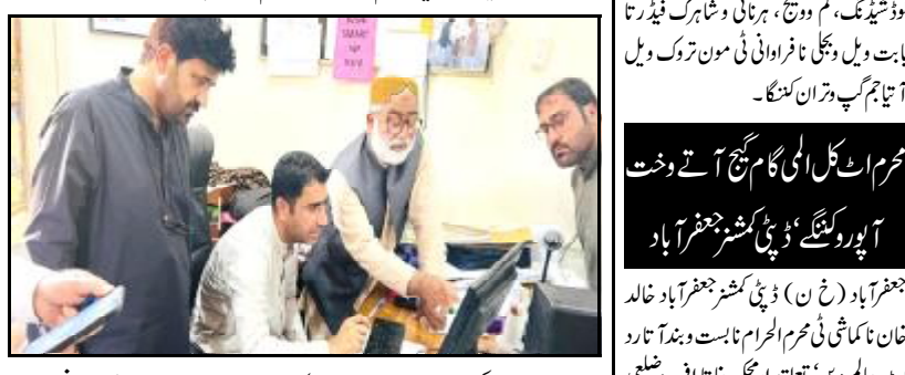
جہانی وزیر موسمیاتی سازی آجہان مرکب آ سحرکاری ہڈی نا سوب کرے۔ اوپارے کہ موسمیاتی ہڈی نا سوب موسمیاتی بیہیز ترین نمان ہڈی نسنے ہراڈان غیر بیٹگی حالت آتشی وڈی نسنے۔ اوڈاہیت زور شاٹا کہ آجحت ناخطرہ نوٹخان تے کم کنگ کن بیٹگی تیاری و احتیاطی گام گنج آتے

اسلام آباد (اے پی پی) جہانی وزیر موسمیاتی سازی آجہرافیائی سیاسی پیش رفت نا کیشیر اثر آتیاہم گپ وڈاٹر کنڈے ڈا کٹر صدق ملک پارے کہ جہانی نظام پد ریسہ کثیر الجہتی اٹ اسہ کنڈی طرز عمل نا کنگڈا ہنسا شکست اٹگ ء۔ اوپارے کہ سندھ طاس معاہدہ کون آ اسٹکن جہانی معاہدہ ء اسہ کنڈی وڈاٹ معطل یا غیر موثر جوڈ کنگٹ مرکب تو اڈاٹن جہانی معاہدہ غاٹا تقدس وقاعدہ غاٹا تالان جہانی نظام نا باروانی اہم سوچ وڈی مریکہ - موسمیاتی ہڈی نا اثر آتیاہم گپ وڈاٹر کنڈے جہانی وزیر پاکستان اٹ سازی آ نوکاپ آجہان مرکب آ سحرکاری ہڈی نا سوب کرے۔ اوپارے کہ موسمیاتی ہڈی نا سوب موسمیاتی بیہیز ترین نمان ہڈی نسنے ہراڈان غیر بیٹگی حالت آتشی وڈی نسنے۔ اوڈاہیت زور شاٹا کہ آجحت ناخطرہ نوٹخان تے کم کنگ کن بیٹگی تیاری و احتیاطی گام گنج آتے