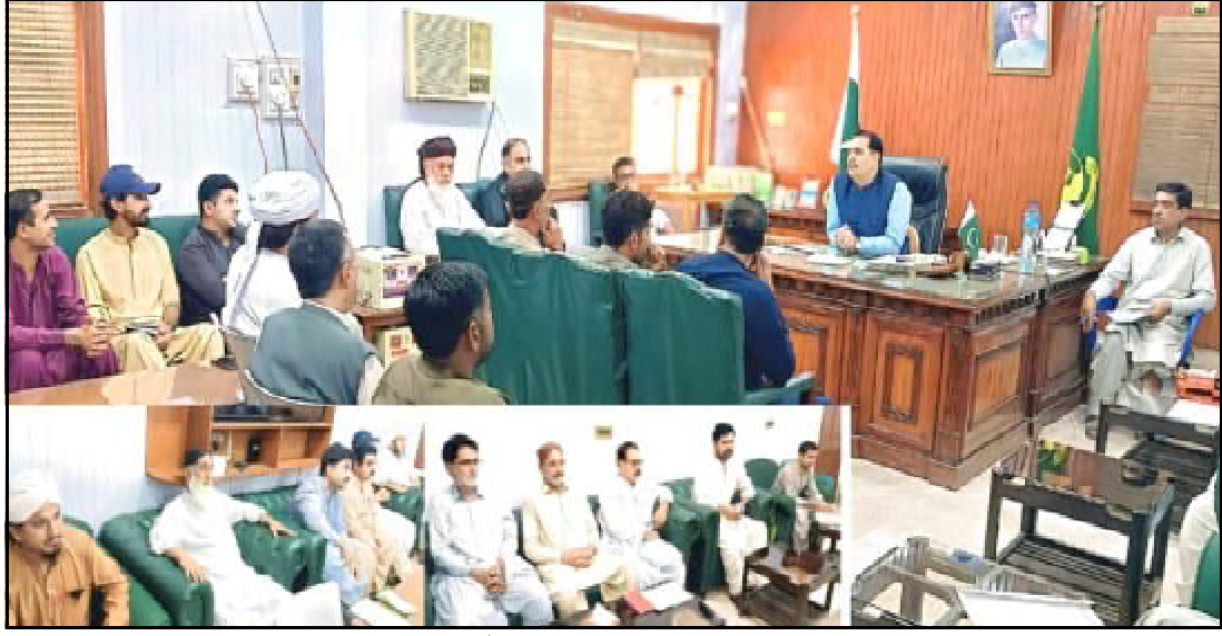
جعفر آباد ڈوچنی کٹھن خالد خان محرم الحرام نا وخت عالم دین اشر آتارو اڈ بلک دیوان نا کاشی ء کنگ اٹی ء

اسلام آباد (اے پی پی) جہانی وزیر ڈت ہندی و خوداری پروفیسر اسن اقبال پارے کہ جی اٹھارٹی و اٹھارو مصنف عطا اللہ حسن قریشی نا پین آن بھلو بیورٹی سے ٹی اٹھارٹی حسن قریشی چیئر جوڈ کنگٹ نا سلاہ ہائیر ایجوکیشن کمیشن ء تننگ ء بیٹش پریس کلب اسلام آباد ٹی اٹھارٹی حسن قریشی ایماڈر اٹی اٹی اڈاٹرک ہزار خواہی و وڈاٹ تران کراسا اسن اقبال پارے کہ اٹھارٹی حسن قریشی اسد سہرغ آٹا خاگلن اسد جاسد اس کس، ہرا اسونو صحافت بھری ہسپتال، قومی خدمت آتے ہمام ہتھنگ ء اوپارے کہ اٹھارٹی حسن قریشی ذات اس صحافت اسد اپورہ بیورٹی اس کس و اوعلمی وڈاٹ واپک کرے کہ قلم نا ہنسی و ہمارا نا کاریم اٹھارٹی حسن قریشی چیئر نا سلاہ ملی پرنیپال نا ہندا نا جم ودرہ لورالٹی (خ ن) ڈوچنی کٹھن لورالٹی کمیشن (مرحوم) حسیب شیخ اسی چیئر سینیماز ہیلکری پروگرام سرکاری وود و ایلو رانی ورسٹاپ آٹا گئی اہم، سلاطین دیوان، تعلیمی و ہیلکری پروگرام و ایلو بیٹینی سر جڑ آتے اڈاٹنگ اس سلاہ ملی پرنیپال نا ہندا نا جم ودرہ ء کرے وڈاٹ آجہندی پہلو تا جہاچ ء بلک ء دورہ نا وخت آ ڈوچنی کٹھن تھتھار اٹھارٹی حسن اوور سلاہی ہندا نا کچی اسی ریٹنگ بیک وودنی رقیپا پارنگ آسرنی سیکورٹی بست و بند و آجحت اس وودک آ اسی کرج آتے مون آتھسا وڈاٹ نا فائدہ غاٹا جم جہاچ ء بلک نا وخت آ اوڈے وڈاٹ نا ہائی وڈو وڈل وگمانی فائدہ غاٹیاں جم آ گاہ کنگے۔ ڈوچنی کٹھن پارے کہ