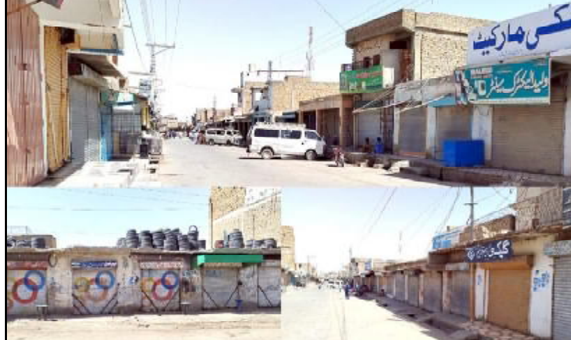
نوٹھنے ٹی این پی نا جہانی خواست آ کرک شروڈاٹن ہرنا وخت آڈکان واپاری ہندا آک بند ء

سرکاری نظام اٹی اسوچ اسے کہ اگ کھم سے نا پور و بخت خوج مہف تو بروک آسال اونا بجٹ اٹی کنگ کیک مریک