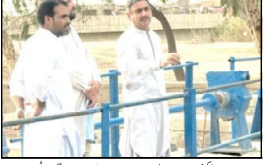
..... استا محمد: ڈی پی کھنڈر رمضان پال دیرکار نا بانداٹ آتا جا چاچ ء بلنگ ائی ء

چاچی (نامہ نگار) ریکوڈک ء سینڈک ء ضلع خٹنگ ائی ء تو ضلع چاچی نا جتا کننگ زور اکی اے۔ ضلع چاچی ء خٹنگ نا جاگہ ضلع چاچی ء حلقہ نو حلقہ جوڑ کننگ ء ریکوڈک ء سینڈک برہہ ارا ڈٹ ارض ء ضلع چاچی نا چچار تارنج ء وزگزران ء۔ وڈاٹ آتے چاچی آن کھسا پوکس ء بست وندی یونٹ اس جوڑنگ وڈاٹ نا جاگہ اس تون زور اکی اس مرکیک ء ریکوڈک ء سینڈک نا خٹنگ کئی سال آ تیان چاچی نا قبیلہ نا تلکیت ء۔ وڈاٹ نا بندخ آک کئی دہائی تیان ء وسیلہ نا تاکہ ء کرینے