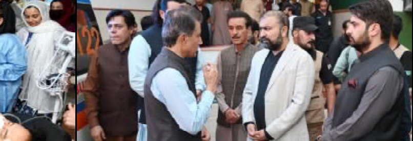
..... کوئٹہ: وزیر اعلیٰ بلوچستان میر سرفراز بھٹو ء عرا نا ستر نا دورہ نا وخت آ کمار آک بریننگ کننگ ائی ء

کتان (سلیم ساسو) ایم آر ڈی ایل نمٹ نا کنڈ آن سینڈک نا شش ہندی کلی تیشی عید پیکیج آتا شیخ و پانٹ عید نا خوشی نا وخت ایم آر ڈی ایل نمٹ (ایم سی ریسورسز ڈیولپمنٹ کینی بریوٹ لیٹنڈ) نا چیئر مین Zhang Zhijun نا کنڈ آن سینڈک نا شش ہندی کلی تیشی عید ناراشن پیکیج قربانی نا ساہدا ر ہم شیخ پانٹ کننگ ء۔ وادو ائی ایم آر ڈی ایل نا وائس پریزیڈنٹ رمضان علی، وائس پریزیڈنٹ ذوالفقار بھالدری، وائس پریزیڈنٹ میرگ بلوچ، اسٹنٹ پریزیڈنٹ واگ شو و ایڈیشن آفیسر آصف موی تون اوار جتا قبائلی