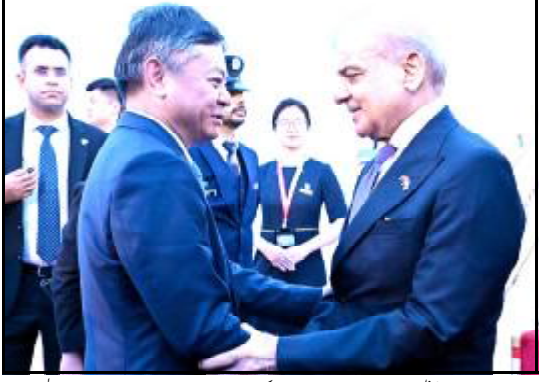
..... پیچنگ: وزیر اعظم شہباز شریف ء چین نا چا گڑدھ وڈر پرواگ روگ خیرنگنگ ائی ء

بلوچستان پارے کہ اقوام متحدہ نا جنرل آسبلی نا کنڈ آن پڑوان پر مارخور جہانی دے اوکیو وار سال 2024 ائی اڈتنگ ء او پارے کہ مارخور (Capra falconeri) اسراہم ء چا گڑدی وڈاے ہرانیائی و سولجی ایشیا نا ہی علاقہ پاکستان ائی ہم خٹنگ ء وزیر اعلیٰ پارے کہ بلوچستان ء دا ہیبت آ کمر ء کہ وڈاے نایاب جنگلی حیات نا اہم آ ہند آک ساری ء، صوبائی حکومت خلیس مون تروک جنگلی حیات نا رکھ وبقا کن تینا ارادگی آسلوک ء او پارے کہ مارخور نا رکھ اصل ات نن تینا قدرتی میرات و چا گڑدی بربری خلیس آتینی قدرتی ہند آ جس منگ ء کاندو آ ن چپ شکار و موسمیاتی بدلی زہم آک اور ء۔ اوستی پارے کہ مارخور وادو ا قدرتی چا گڑدی