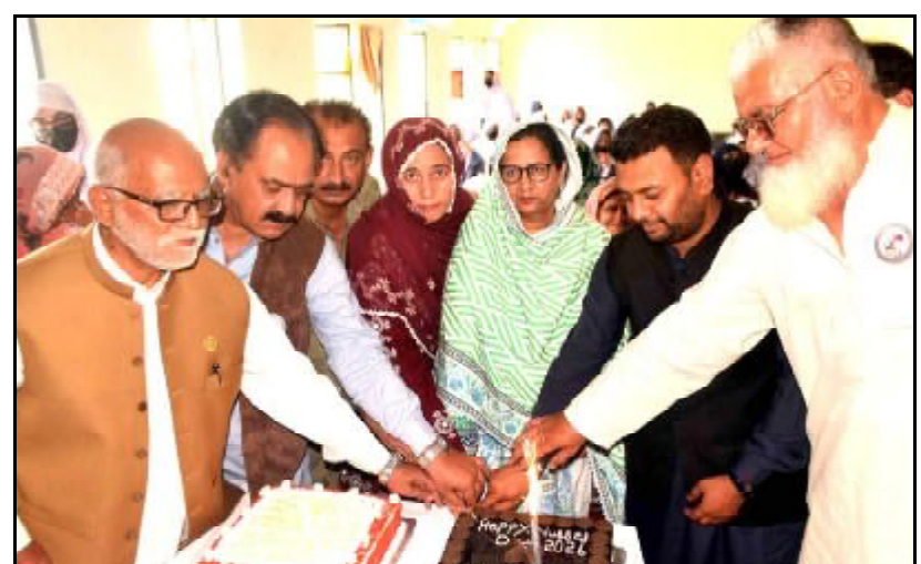
.....کوئٹہ ایس ایس پی چنچ ہسپتال چشین ڈاکر عیسیٰ رضی ڈائریکٹر نرسنگ کلوم، اقبال پریس نرسنگ کالج چشین ریاض لوئیس و ایلو ک نرسنگ نا جانان و سنا رداٹ کیک کاٹ کننگ اٹی

منگور (نامہ نگار) گورنمنٹ گزل انٹر کالج عیسی و گورنمنٹ کول ہائی سکول زکی سٹی نا جوڑ جا ک کاریم تا پورنگون آن پد باقاعدہ ورت اسکول و کالج نا با کمانڈنٹ منگور رائلز بریگیڈ میز نظر اقبال کرے۔ ہائی دو اداخت آ یو این ٹی ایل ناظم ڈاکر علی بلوچ، ہیز مسٹرس، کالج پریس و استاد ستون اوار چناتا بملوچ اس شیج بلک۔ ہائی دو آن پد کمانڈنٹ ایف سی منگور رائلز بریگیڈ میز نظر اقبال کلاس آ تا دورہ و کرے و چناتیاں نقد انعامس۔ دا کان بیوس کل کلاس آتے ئی چناتے نقد انعام ہر مس۔ کمانڈنٹ ایف سی