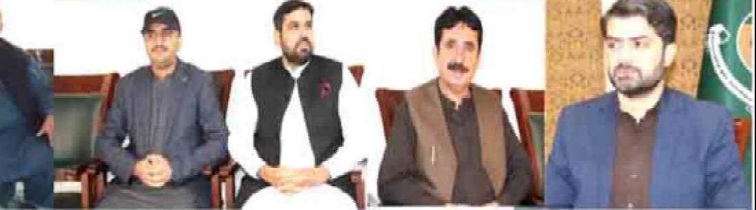
کوئٹہ ڈی جی کشر عبداللہ بادینی شارات خا کنگ اتا تو کنگ تا بابت ڈبلو ک دیوان تا کاشی ء کنگ اتی ء

کوئٹہ (اے پی پی) پاکستان مسلم لیگ (ن) تا قومی اسمبلی تا باسک سر دار یعقوب خان تا صراہان و امریکہ تا نیام اٹ سفارتکاری جہائی تا بوز کو سیاسی و عسکری سرکردہ خانے گچین لوڑ آتینا خرم خچین چش کرینے۔ چارھنے تا دے ات تینا جاری بیان اتی سر دار یعقوب خان ناصر پارے کہ فیملہ مارشل سید عاصم منیر وزیر اعظم میاں محمد شہباز شریف بے کچ چا ہمداری، ڈیہیٹو جہائی امن کن ہم اسہ ہرمل اسے۔ قومی اسمبلی تا باسک سر دار یعقوب خان ناصر صرستی پارے کہ پاکستان مام امن و تین پینتی شرف تا خواہمدار سنے و سفارتکاری جہائی پالیسی تا ناصر پارے کہ مون آڈنگ و اومیت داوڑا درشانی ء کرے کہ دا جنگ بندی آختی چک مریم و ڈیہہ اتی آختی امن و سوکوی تا کرے آوار کیک۔ اوپارے کہ جج آ قوم تینا سرکردہ خانوں سلو ک ء و ہر ہر وڑا اکل گام گچ آتخ تنجی اس ادا کرینے چارھنے تا دے "یکس" آ تینا اسر بیان اسے ئی اوپارے کہ تا ب