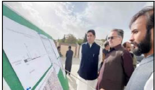
سر دار او ایس لغاری تا جنگ بندی چک کنگ آ وزیر اعظم و فیملہ مارشل تا سنا

جائی کی تکی جنگ ء و امن تا کسر اور ملنگ ء نن اومیت کیند کہ پاکستان تا مکاری ٹی مرک آ مذاکرات اتنی جنگ چنگ۔ اپارے کہ اراہنتہ تا جنگ بندی آختی امن دینا اسہ بھلو بھکاری سے آن بچا پاکستان ڈیہیٹو امن کن اہم و گچین کٹر دادا کرسا ایران، امریکہ تا نیام اٹ جنگ بندی کرنے ہراڑان ڈیہہ اسہ بھاز بھلو بھکاری سے آن بچانے۔ اپارے کہ پاکستان تا شت و گچین - عمارت کاری جہائی کول آتینا چک سنے پاکستان ء جہائی امن تا مون آڈنگ ء شت سفارتکاری آ پائے فوئل اعہام تنگے۔ اوپارے کہ وزیر اعظم پاکستان، وزیر خارجہ و فیملہ مارشل ایران و امریکہ تا نیام اٹ جنگ ء تو رنگ کن دے ذی کوشت کریر اللہ تعالیٰ پاکستان ء سرب کرسے و ملک خدا نیاد پاکستان تا بیر کج آڈنگی کرکنگ کیک کن انسانیت ء اسہ بھلو بھکاری سے آن بچین و پاکستان تا امن ڈٹ جہائی سفارتکاری تا تاریخ ناروشنا ء۔