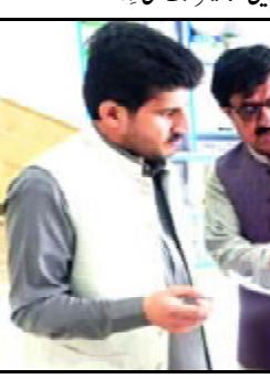
کشتاریک ملازم آتھون بے انصافی واپس و، میر رحمت بلوچ