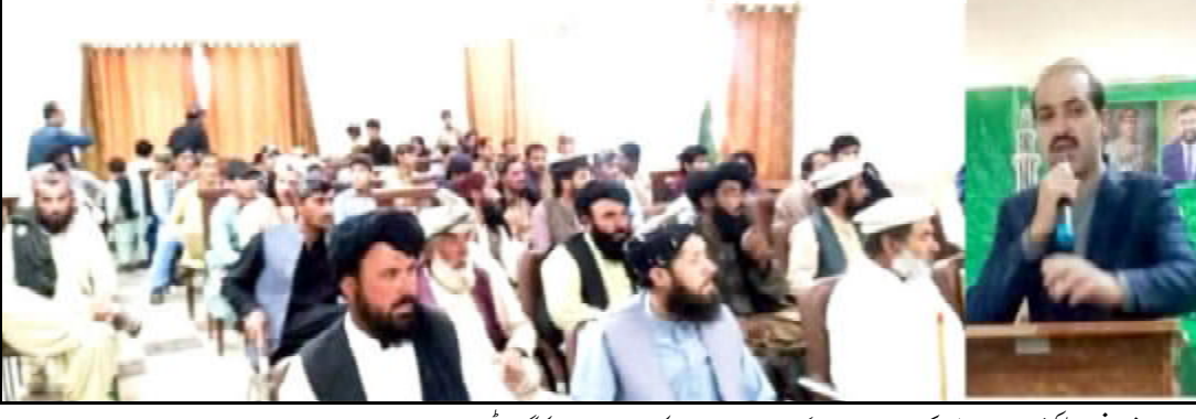
..... شیرانی ڈیپٹی کمشنر حضرت ولی کار 23 مارچ یوم پاکستان نارداٹ اڈوٹرک دوڈا ن تران کننگ ائی و