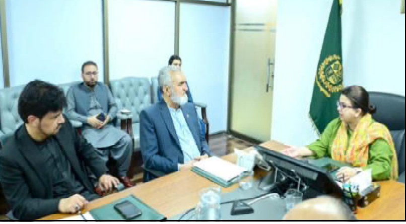
..... اسلام آباد جنائی وزیر ملی کام شرفا خیر بختون گلگت بلتستان ناگمران وزیر اعلیٰ ہارمہ ناصر او ڈی کننگ ائی و

پشاور (اے پی پی) گورنر خیر بختونخوا، فیصل کریم کٹھنی، جمیٹ علماے اسلام ناگزیت نا سینئر راہنمون و بی آ سیاسی و راہی شخصیت حاجی عبدالملک ناگزیت آہڑ ز خواہی کرینے۔ گورنر ہاؤس پشاور نا ترمان نا رداٹ تینا ہڑ ز خواہی کاہوئی گورنر خیر بختونخوا پارے کہ ایماڈار نا نظریاتی و سیاسی خدمت اکس اسے آن ڈوک افس۔ او ایماڈار نا دریدجا نا ہڑ ز خواہت و صابوت کس ہر میل نا عا کرے۔