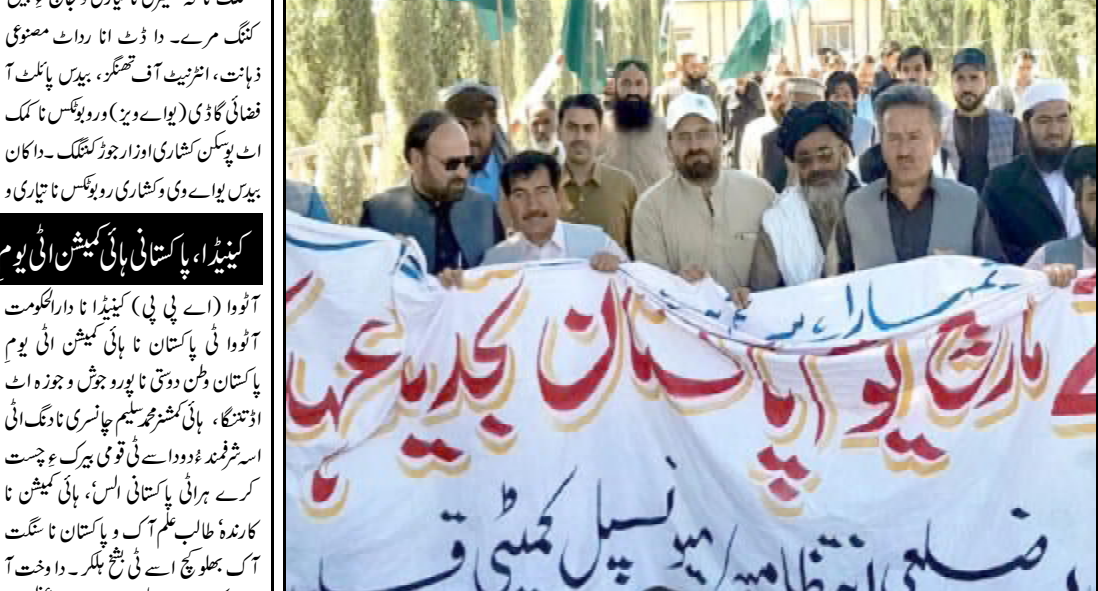
کینیڈا، پاکستانی ہائی کمیشن اٹی یوم پاکستان و جوش و جوزہ اٹ ڈسٹنگ