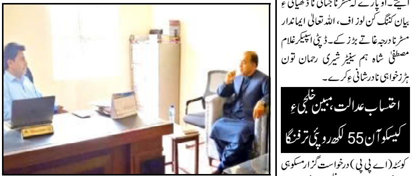
لورالائی ٹی سفائی مہم، ودیاری نارخراف آپریشن وسرکاری ادارہ غانا کارکڑو جوان کنگنگ کن گام گنج کنگنگ