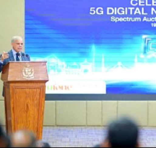
..... اسلام آباد وزیر اعظم شہباز شریف 5G ڈیجیٹل نیشن پاکستان نا بنائی وڈوڈ تران کنگ انی ء

ریاض (ویب ڈیسک) امریکی سفارت خانہ سعودی عرب انی ساڑی امریکی کرشل غلامت آتیا کنگ ملک ء ایئر، اٹخے کہ سعودی فضائی ونگ انی میزائل وڈرون نظرہ غاک ونگ انی ء۔