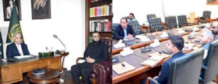
..... لاہور وزیر اعظم شہباز شریف دیوان نا کاشی ء کنگنگ ء

کراچی (آن لائن) سکوتی گورنر سندھ کارمن ٹیسوری پارے کن ارا سال اسکان کلاں بلوک آ ہزار طالب علم آت آت آجت ء گوہمٹنگ کن اظہر ء۔ اسیان اسے تی پارے کن طالب علم آت کورس پورومٹنگ اسکان آتی تی پروگرام ء امر کرے برجا چنگنگ گام گچ کنگنگ اٹی اٹ و پروگرام ء برجا چنگنگ