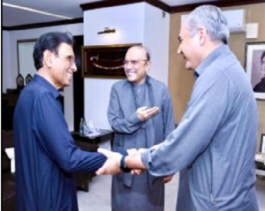
..... کراچی صدر مملکت آصف علی زرداری تون بجائی وزیر داخلہ و ایم کیو ایم راہبشون خالد مقبول صدیقی اوڈ دتی کنگنگ اٹ ء

کراچی (آن لائن) صدر مملکت آصف علی زرداری تون بجائی وزیر داخلہ غنم نقوی و ایم کیو ایم پاکستان نا چیئر مین ڈاکٹر خالد مقبول صدیقی وڈا دتی کرے۔ اوڈ دتی تی قومی سٹیجی، سیاسی ہم گرتی و جمہوری عمل نا صدر مملکت داخلی سلامتی ء سکو کنگنگ واس نا صدر مملکت داخلی سلامتی ء سکو کنگنگ واس نا اوڈ دتی تی قومی سٹیجی، سیاسی ہم آتگی و جمہوری عمل نا وڈ دتی نا ہیبت اٹ ہم ہیبت و امن و ایمنی نا بابت کپ وڑاں کنگنگ۔