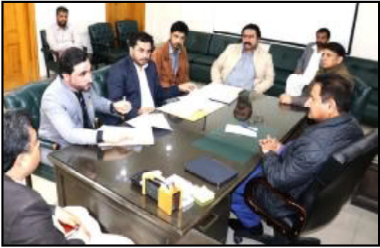
.....کچھی، اسسٹنٹ کمشنر چھالیات علی جوتی بیٹک نا راجی استھانی ہندا آتا جاچ ء بنگے ء

اسلام آباد (اے پی پی) بنجائی وزیر پارلیمانی بامدات ڈاکٹر طارق فضل چوہدری بچھ دیئیں نا پارلیمانی کھین کارنی تیش بچھ دیئیں شہنشاہ پارٹی (بی پی پی) نا کنگے آپارٹی نا راہنماں طارق رحمان ء مہارکبادی جیش کرسا ٹیک است خواہی نا درشانی ء کرینے۔ جمعہ نا دے راجی رابطہ نا ویب سائٹ آکس آتیا اسد تہنیتی کھابو اے ٹی او بچھ دیئیں نا اس ء ہم سرسب کھین کارنی او ڈھنگ آپارٹی آمارکبادی جیش کرسے ء دا اوہیت نا درشانی ء کرکے پرتوم آملک آک آجت است پرتوم اس سوچی کنگے نا تعلقلاری سے سوگو کنگے، سوچی ایشیا اوارن جیش اس، سوگو ء شونڈاری نا ایشیا ٹی ہرف آتے مون ڈھنگ کارنی اوارنی کنگے نا اسی ٹیک آن مہالو نا۔ اوپارے