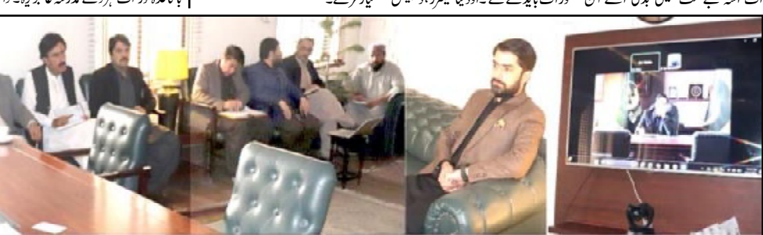
.....کچھی، اسسٹنٹ کمشنر چھالیات علی جوتی بیٹک نا راجی استھانی ہندا آتا جاچ ء بنگے ء

اسلام آباد (اے پی پی) بنجائی وزیر واپار جام کمال خان تروک آتے نیئیں یونیورسٹی آف ٹیکنالوجی نا دورہ ء کرے۔ تہنا دورہ ٹی او بیورو سٹی نا اسمبلی اسے ان بطور مہمان خاص تران کرسا پارسے کہ تعلیمی ادارہ غاتے صنعت تون ہم گرنچ کنگے ء پاکستان ء ترندی اٹ چٹو ک جہانی ٹیکنالوجی نا مومن اندارہ کن تیار کنگے نا دمستی گرج ء۔ جام کمال خان پارسے کہ دنیا آرٹیفیشل انٹیلی جنس ء ڈیٹا اینالیٹکس، کوانٹم کمپیوٹنگ ء آڈیوشن و ڈیجیٹل پلیٹ فارم آتیا ن مکمل بنگے ء۔ اٹ اسرے مٹے کھیتی بدلی اسے آن