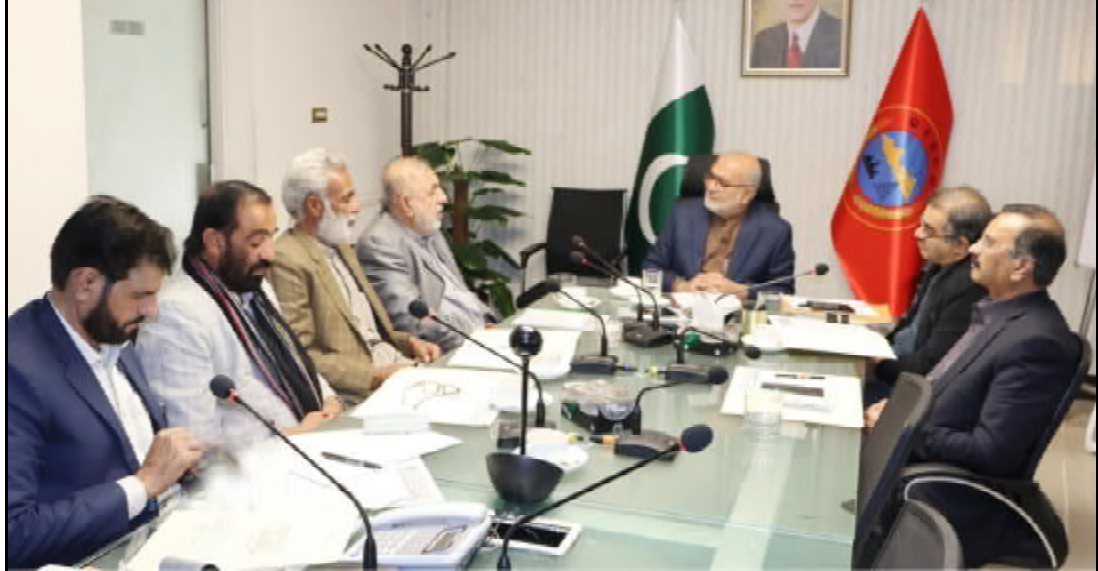
.....کچھی، اسسٹنٹ کمشنر چھالیات علی جوتی بیٹک نا راجی استھانی ہندا آتا جاچ ء بنگے ء