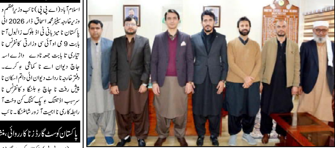
.....کچھی، اسسٹنٹ کمشنر چھالیات علی جوتی بیٹک نا راجی استھانی ہندا آتا جاچ ء بنگے ء

ریڈیو پبلک کشاری شونڈاری، چاگڑی شعور ء دودرہ بیدہ ٹی شون ولسی آگاہی ٹی اہم کڑو ادا کنگے ء، جہانی ریڈیو دے نا وخت آکھو اسلام آباد (اے پی پی) وزیر اعظم شہباز شریف پارسے کہ حکومت ڈیجیٹل پاکستان نا وڑ نا روات میڈیا و آئی ٹی نا شیخ آتیشی چدت ء مومن اڈنگ ء، غف اوارنی است قول کین کریدہ یونان اوار غف پاکستانی میڈیا ء پکسن آخواست آتون ہم گرج کرسا اودے سچائی ء زموری قومی کھیتی نا سوگو زید اس جوڑ کیندے ادا خیل آتا درشانی ء جمعہ نا دے اڈو وزیر اعظم آسٹ نا میڈیا وگ آن جہانی ریڈیو دے چاری کھابو اٹی کرسے۔ وزیر اعظم پارسے کہ ایون جہانی برادی تون اوارنی است ”جہانی ریڈیو دے“ ء اڈتنگ آن،