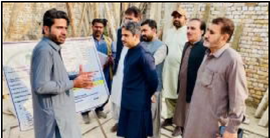
.....کچھی، اسسٹنٹ کمشنر چھالیات علی جوتی بیٹک نا راجی استھانی ہندا آتا جاچ ء بنگے ء

اسلام آباد (خ ن) جینئر پرن بلوچستان کمیشن آن دی ایشیٹس آف وسین نا دیوان اٹی شیخ بک دیتیا متنا عاک شیخ بک بلوچ جینئر پارٹی نا نیازی رایشون کرن بلوچ نیشنل کمیشن آن دی ایشیٹس آف وسین نا سرک اٹی اسلام آباد اٹی اڈولک آسلاقی دیوان اٹی شیخ بک۔ دیوان اٹی نیازی نا حق آتا رکھ، سنی سبیری نا شونڈاری ومادگی شونڈاری نا ہرف آتا دونی کنگے کن پالیسی سازی کاریم اٹی نیازی نا بھری نمائندگی ء پیک کنگے آسرم ڈٹ اٹنگے۔ چندی سرکاری