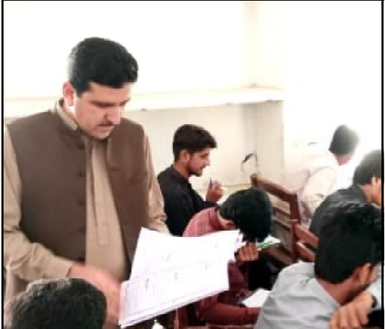
.....نصیر آباد، اسسٹنٹ کمشنر بہادر خان اسمبلی سینیٹر ناچاچ ء انک داخست پچھرتے انک ء

اسلام آباد (اے پی پی) قومی اسمبلی پارلیمنٹ اور نازان نامنتواری کی تحریک منظور کرنے کے لیے پارلیمنٹ میں ایک قرارداد پیش کی گئی ہے۔ اس قرارداد میں کہا گیا ہے کہ نازان نامنتواری کی تحریک کو منظور کیا جائے اور ان کو تمام حقوق دیے جائیں۔