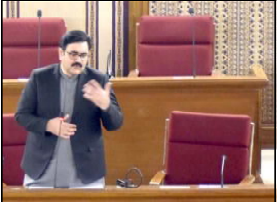
.....کونڈھو بجائی وزیر تعلیم بخت محمد کراچی اسمبلی اجلاس آن ننگ کنگ ائی ء

اسلام آباد (اے پی پی) بجائی وزیر تعلیم و کسب ہیلکاری ڈاکٹر خالد مقبول صدیقی نے نالج اکانومی و مصنوعی ذہانت آجبت ناکسرک ء کے بارے میں ایک تقریب میں خطاب کرتے ہوئے کہا کہ تعلیم اور دانش ناکچین کاری کے لیے سب سے پہلے نالج اکانومی اور مصنوعی ذہانت کو ترجیح دینا ضروری ہے۔ انہوں نے کہا کہ نالج اکانومی اور مصنوعی ذہانت کو ترجیح دینے سے ملک کی معیشت تیز رفتاری سے بڑھے گی اور ملک کو عالمی سطح پر ایک ترقی یافتہ ملک بنانے میں مدد ملے گی۔ انہوں نے کہا کہ نالج اکانومی اور مصنوعی ذہانت کو ترجیح دینے سے ملک کی معیشت تیز رفتاری سے بڑھے گی اور ملک کو عالمی سطح پر ایک ترقی یافتہ ملک بنانے میں مدد ملے گی۔