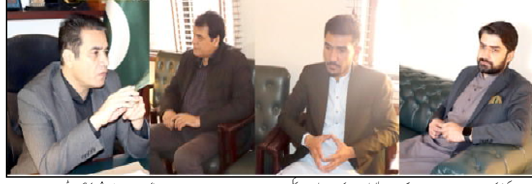
کمشنری ڈویژن اسلام آباد فیض ڈویژن ای پی آئی نا کس فرس نا دیوان ناماشی و کنگ ای