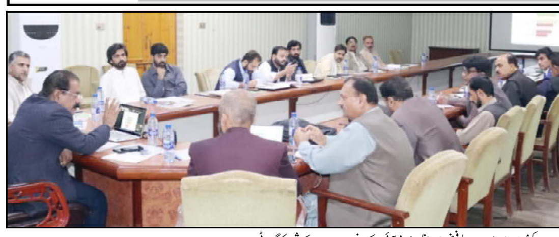
کمشنری ڈویژن اسلام آباد فیض ڈویژن ای پی آئی نا کس فرس نا دیوان ناماشی و کنگ ای