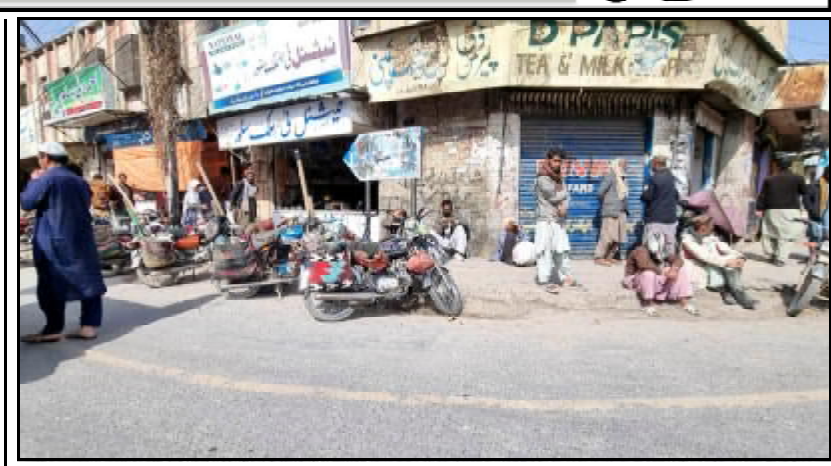
کوئٹہ، باچا خان چوک آسٹریا روزگار کن ٹولک