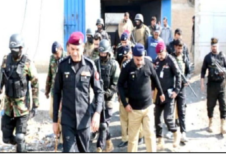
..... کوئٹہ: آئی بی پولیس بلوچستان محظا ہر پولیس انچین نیوسر یاب نادرہ ء کنگ اٹی ء