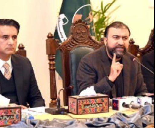
..... کوئٹہ: وزیر اعلیٰ بلوچستان سرفراز گنئی پریس کانفرنس کنگ اٹی ء

تہران (آن لائن) ایران، روس و چین نے بحر ہند میں مشترکہ عسکری مشقوں کا انعقاد کیا۔ انہوں نے کہا کہ یہ مشقیں ان کی دفاعی صلاحیتوں کو جانچنے کے لیے ہیں۔