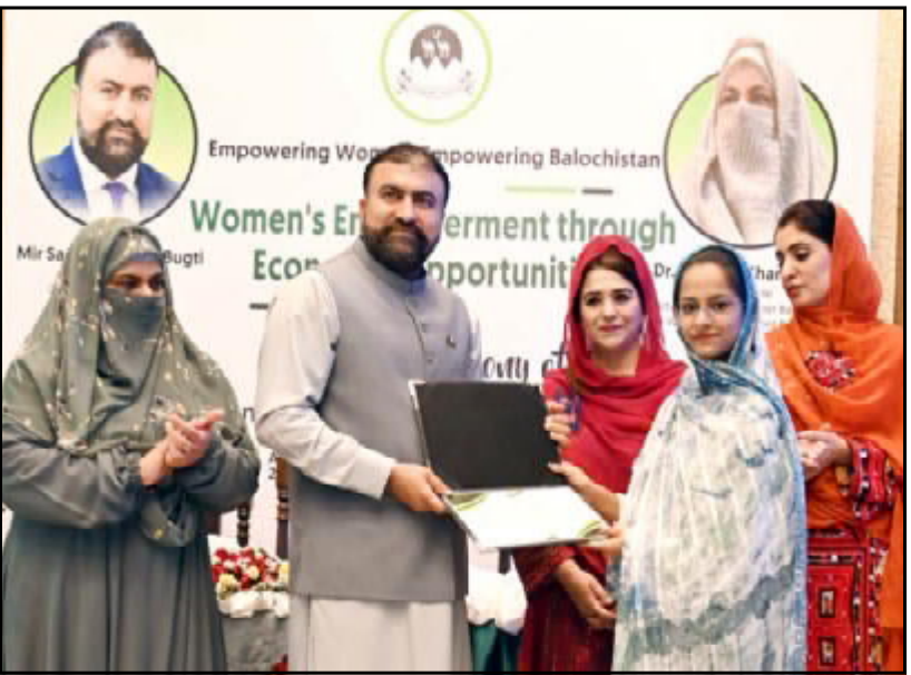
کوئٹہ وایب کیب اٹی اوغان مہاجر آتیکہ اٹی ریٹولک و کرشل ایریا سر دار سخرانی خاہوت نا باوہ بیہرہ ٹی میرات نا کاہنگ اٹی