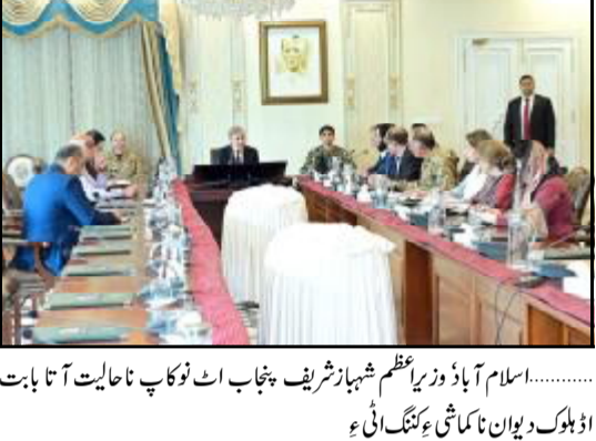
.....اسلام آباد وزیر اعظم شہباز شریف پنجاب اٹ نوکاپ نا حالیٹ آ تا بابت اڈولک دیوان نامکاشی ء کنگلک ء