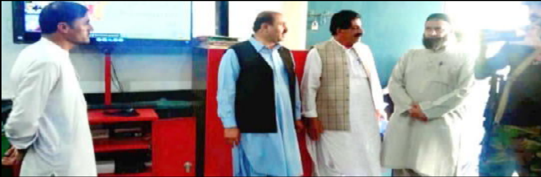
اورالائی ایڈیشنل کمشنر نوعلی کارکردگی ای ای احمد مدثر گوشت ہائی اسکول بلوچ کالونی نادورہ ڈسٹنگ اٹی