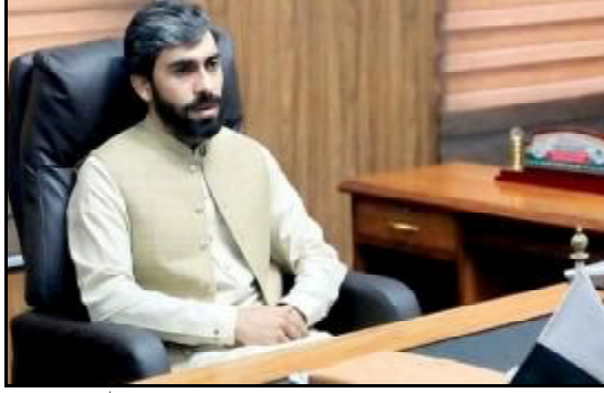
جام کمال خان پارے، وزیر واپار پوریاء برادری

اسلام آباد (اے پی پی) بنجائی واپار وزیر جام کمال خان پارے نے حکومت پوریاء برادری نایاب اولڈ ویلڈیٹنڈ او ایس کے ڈیجیٹل ایپ کے ترقیاتی کاموں کی پیشین گوئی کی۔ انہوں نے کہا کہ ایپ کے ذریعے گیس و ٹریف کی ناکاشی کی جائے گی۔