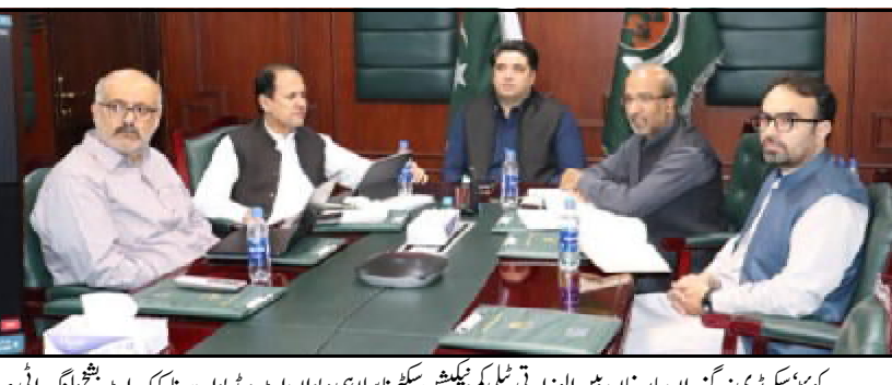
ملک کی تیل و گیس ایس کے ڈیجیٹل ایپ

ملک کی تیل و گیس ایس کے ڈیجیٹل ایپ، ملک کی تیل و گیس ایس کے ڈیجیٹل ایپ