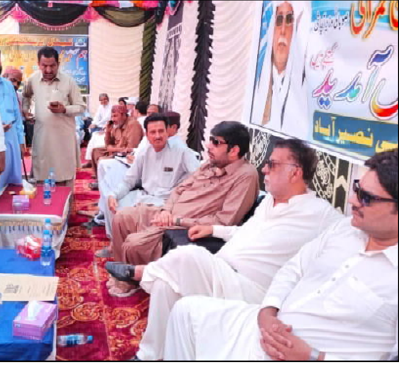
سوئی گورنمنٹ اور واپار و زرعی ناکاشی