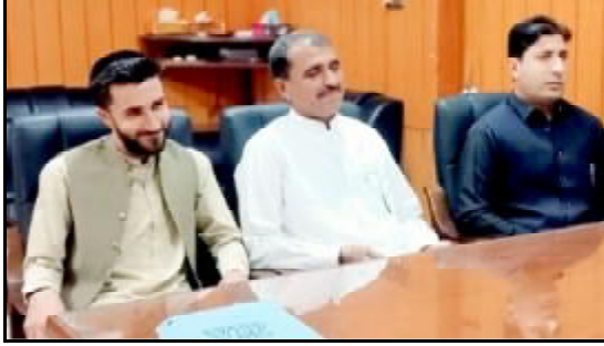
جام کمال خان پارے، وزیر واپار پوریاء برادری

جام کمال خان پارے نے کہا کہ ایپ کے ذریعے گیس و ٹریف کی ناکاشی کی جائے گی۔ انہوں نے کہا کہ ایپ کے ذریعے گیس و ٹریف کی ناکاشی کی جائے گی۔ انہوں نے کہا کہ ایپ کے ذریعے گیس و ٹریف کی ناکاشی کی جائے گی۔