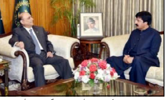
..... اسلام آباد و صدر مملکت آصف علی زرداری تون گورنر پنجاب سلیم حیدر خان اور ذہبی کنگنگ ائی ء

قوانا اجونی مسلائی ہونہا قربانی منسوعہ ارجی حریف