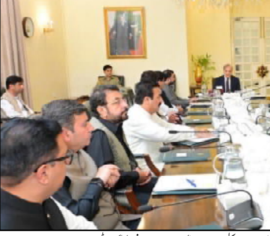
..... اسلام آباد و وزیر اعظم شہباز شریف بلوچستان نا بجلی تابا بت اڈہ بلوک دیوان نا کاشمی ء کنگنگ ائی ء

کشمیری اس نایل آ تا ایسری کن 23 ارب روپی فراوان کنگنگ نا منظوری