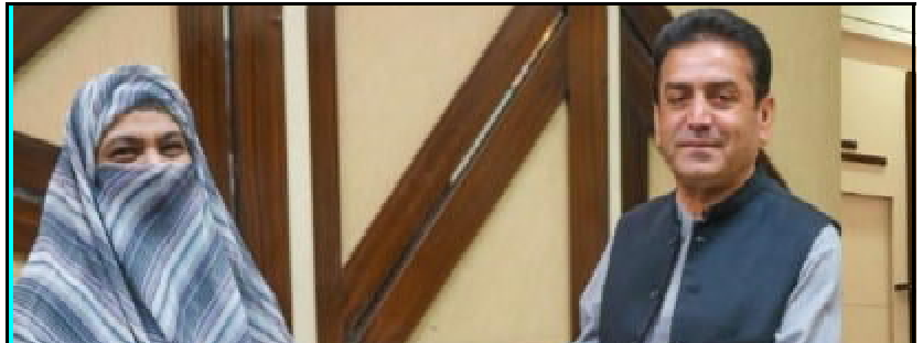
تعلیم اہلکاروں کو ایس کے ڈیجیٹل ایپ کے بارے میں آگاہی

تعلیم اہلکاروں کو ایس کے ڈیجیٹل ایپ کے بارے میں آگاہی، تعلیم اہلکاروں کو ایس کے ڈیجیٹل ایپ کے بارے میں آگاہی