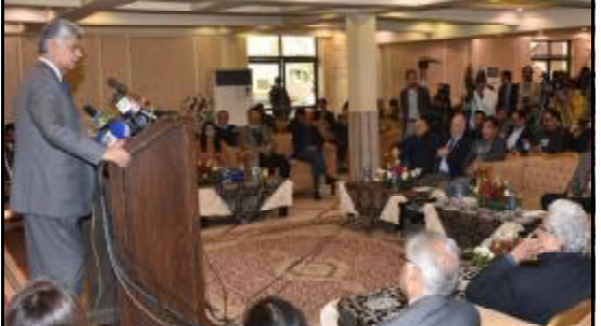
..... لاہور عمران، پنجابی وزیر جواکاری و زمینکاری مر قرضی سوگنی سینہار آن تران کنگ ائی ء

اسلام آباد (آن لائن) آئی ایم ایف صنعتی شیخ اکن ملک نا سلاہ تیا جھنگ کن اوکرے آئی آئی ایم ایف صنعتی شیخ آ سہدی نا ریم ء کم کنگ ء صنعتی شیخ انا بچلی نا بل آتے تی بقی اٹک کن ایشل انڈیسٹریسٹس فیڈریشن کونسل (فیکل) نا سلاہ تیا جھنگ کن اوکرے دانا کنگ اٹ صنعتی شیخ آ سہدی نا ریم اٹ 91 درسا اسکان کئی مریک وخت اس کہ صنعتی شیخ آ بچلی نا بل آتا رداٹ 29 درسد اسکان بچت مریک ء حوالی نا رداٹ واہت پاکستان وائی ایم ایف انتظامیہ نا نیام اٹ ایو دہشتے نا دے آنا کرک برجا ہفت و پچل غا ارات مریک آئی ایم ایف بروک ہفتی بی مریک۔