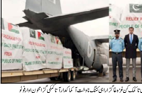
..... اسلام آباد یا پاکستان نا کنڈ آن فلسطینی تا ملک کن غرہ نا گرا اراہی کنگ نا وخت آ کا کارا تا مکئی گرا اھن انا فرور

لکھ روپی ء گوار پور نا رداٹ جینی حکومت نامانی تربت اقلیم وچا جھوڑی نا گٹ سرام ڈٹ آنا مونس پاش کنگ اراڈٹ انا مالیت 50-50 گٹ آتے تی سرام ڈٹ انا مالیت 40 لکھ روپی وخت اس کہ سٹیک ڈٹ انا مالیت 40