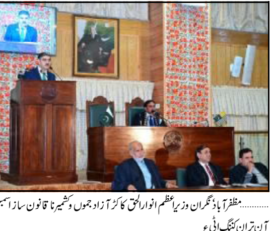
..... منظر آڈیا ڈیگران وزیر اعظم انور الحق کاکڑ آزاد جموں و کشمیر نا قانون ساز اسمبلی