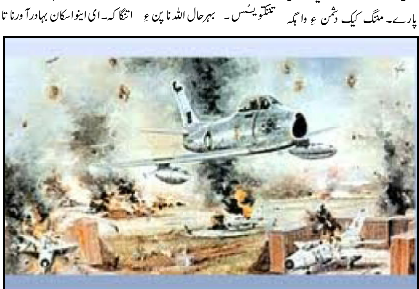
بارڈرات بی آر بی نہر آ تونگے۔ کنا تو چہاٹ پیش تمنا۔ کل بندغ آتے دفتر اٹ چچ منگ نا پارت مس تا کنا انتظام

آتا چاچ و ملنگ۔ کانفرنس مس۔ دا بی فیصلہ کنگا کہ زوت اس کل وارڈ آتے خالی کرفنگے۔ سہی اگا نا جوڑ آتے ہسپتال آن فارغ کرسا یونٹ آتینا پدی رانی کنگے، زیت نا جوڑ آتے ایلو ہسپتال آتینا شفت کنگے و پروڈ نا ایمر جنسی کن تینے تیار کنگے۔ ای ایسین تو آپریشن تھیز نا اچھا رچ سٹ وخت اس کل انتظام آتا تیار و کنا خغ اٹ خلنگا۔ جنگ انت اس مریک۔ دا اندازہ بیرہ بھوک آہیت آتسکان کس۔ ہندا سوب آن کل انتظام آک بھاز پام و سوچنگ کھنگ اٹ کروئی تمنا کہ راست ہر فنگے تو دا وڈ نا ایمر جنسی نا کئے اصل عملی ٹریننگ تکتو یس۔ بہر حال اللہ نا بیغ