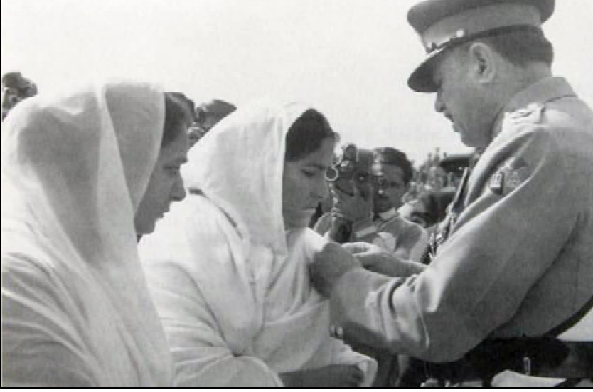
ایکشن سٹیشن مس وکل تینا خاص اگا ہر سال 6 ستمبر نا دے دفاع پاکستان

125 اگست 1965 تا دو و کم تنزگ۔ وخت اس کدے کی بلنگ آن مست مشن نا بنامس و جہاز اتارنخ تینا نا کڈ آ مس۔ دے کی بلنگ آن پد توبے روشنائی کر یکہ استنے کہ ٹوک انا سبزہ چا نژدہ میکوتارنخ کس۔ ستر برجا کس کد آسان آ ہنمحرک بر و پیکن مرسا کریر۔ آسان آ ہنمحرک بر و پیکن مرسا کس ہندن لگا کہ کسبل اسے ٹی ڈکانو تے۔ دا اللہ نا کڈ آن ٹینے غمک اس کس۔ نن نا 07.2300 سحر غا