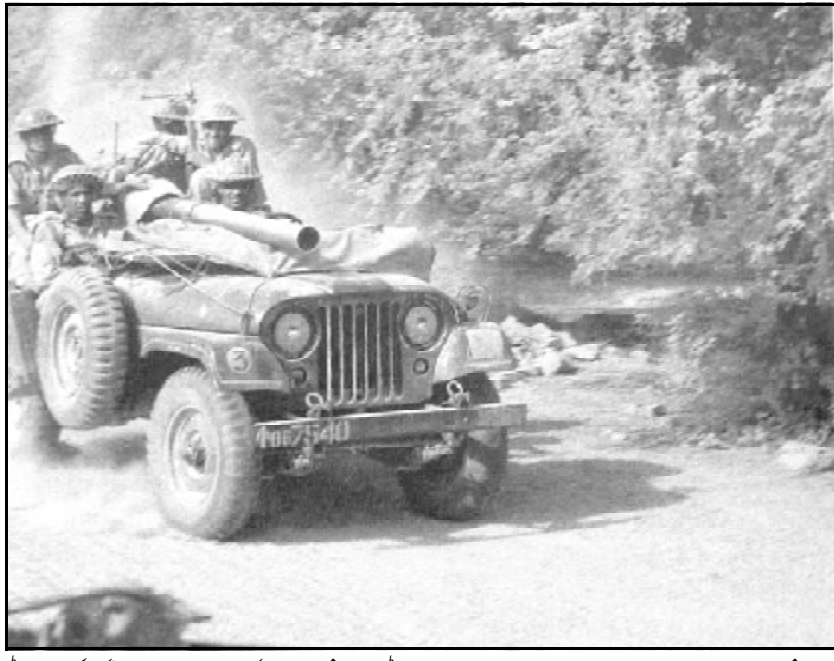
زندہ غمٹ اسے۔ ہرائی پاکستانی قوم و سلبہ ہندوستانی فوج و پاکستانی فوج نا نیام اٹ جھجھو دے پدے آن زیت مرسا کس۔ پاکستان نیوی ہم کھوک گام گچ آتے دوئی کنگ بنا کر سس۔ بی این ایس باہر کراچی شپ یارڈ اٹ جوڑ کنگ کن