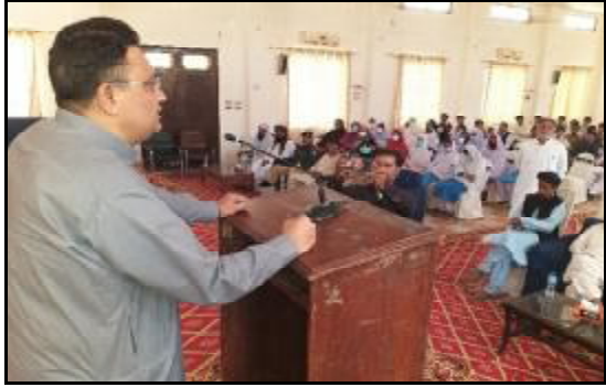
..... نصیر آباد ڈیجیٹل کوشتر ظہور احمد شیش رحیمہ انا پچی آ کالم گار اجمل خان نیازی تا کریت آہر زخواہی

اسلام آباد (اے پی پی) وزیر داخلہ شیش رحیمہ انا پچی آ کالم گار اجمل خان نیازی تا کریت آہر زخواہی اے انانگہ اس گس۔ کالم گار نیازی تا اجمل خان نیازی تا اندازے مٹ گس۔ او دعا کرے کہ اللہ تعالیٰ ایماندار ناخاہوت و صبر و جمیل عطا کرے۔