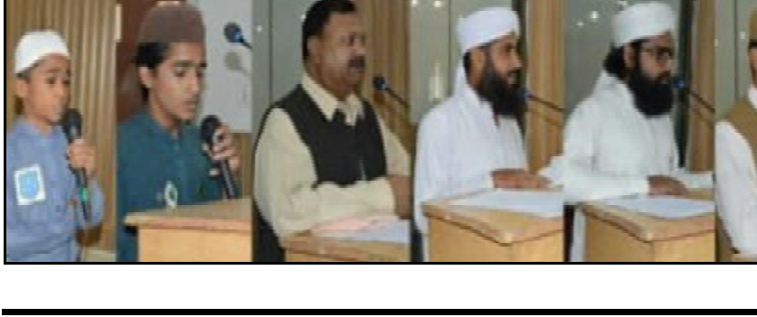
..... سبئی اے سی و جید شریف عمرانی اسسٹنٹ کوشتر شاہ ماجین عمرانی و ایلو کمدار سیرت الہی کانفرنس آن تران کنگ انی