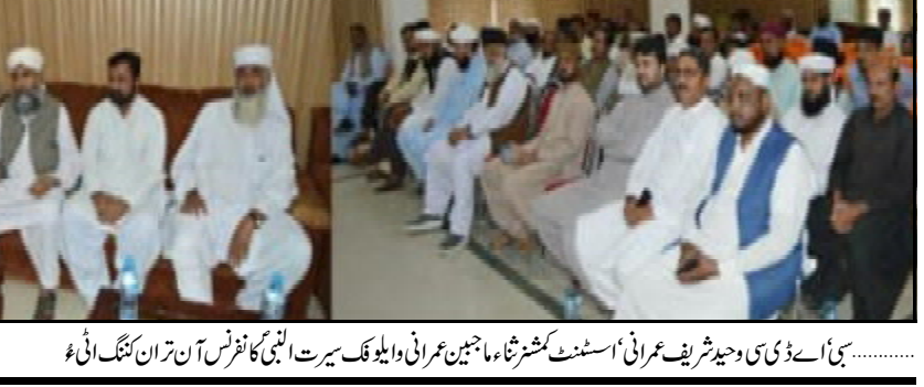
..... سبئی اے سی و جید شریف عمرانی اسسٹنٹ کوشتر شاہ ماجین عمرانی و ایلو کمدار سیرت الہی کانفرنس آن تران کنگ انی