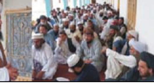
گورڈ شارسو ملی بلوچستان تانہاندوہم تھمک