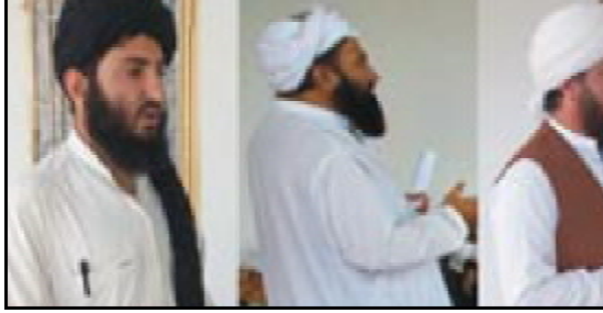
گورڈ شارسو ملی بلوچستان تانہاندوہم تھمک