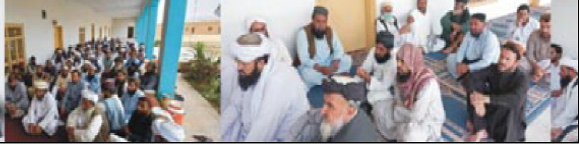
گورڈ شارسو ملی بلوچستان تانہاندوہم تھمک