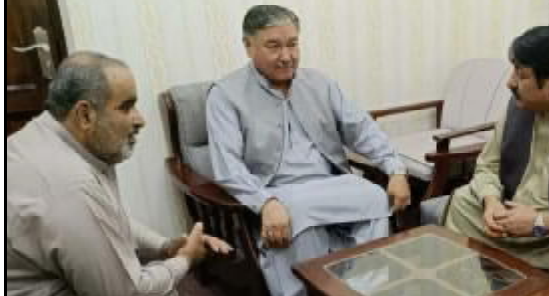
گورڈ شارسو ملی بلوچستان تانہاندوہم تھمک