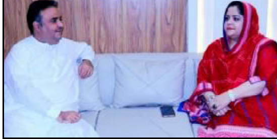
گورڈ شارسو ملی بلوچستان تانہاندوہم تھمک