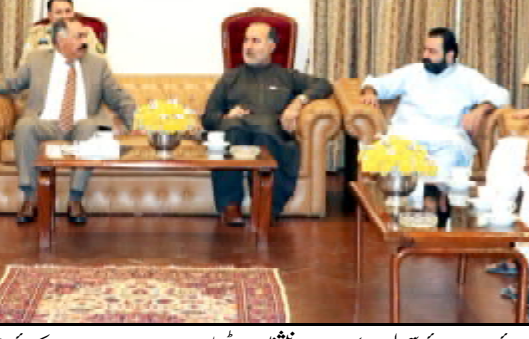
گورڈ شارسو ملی بلوچستان تانہاندوہم تھمک