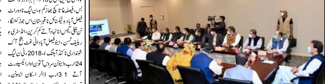
گورڈ شارسو ملی بلوچستان تانہاندوہم تھمک