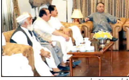
گورڈ شارسو ملی بلوچستان تانہاندوہم تھمک