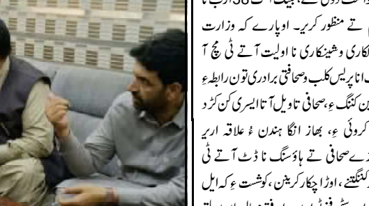
گورڈ شارسو ملی بلوچستان تانہاندوہم تھمک