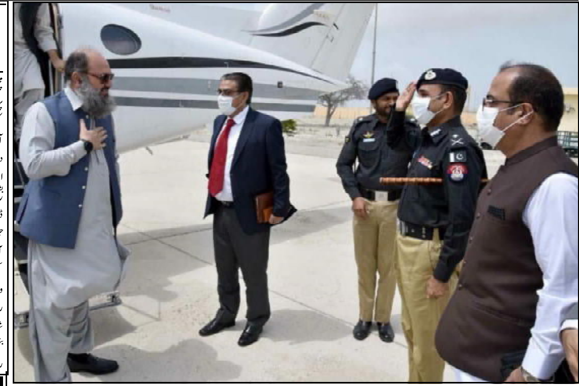
گورڈ شارسو ملی بلوچستان تانہاندوہم تھمک