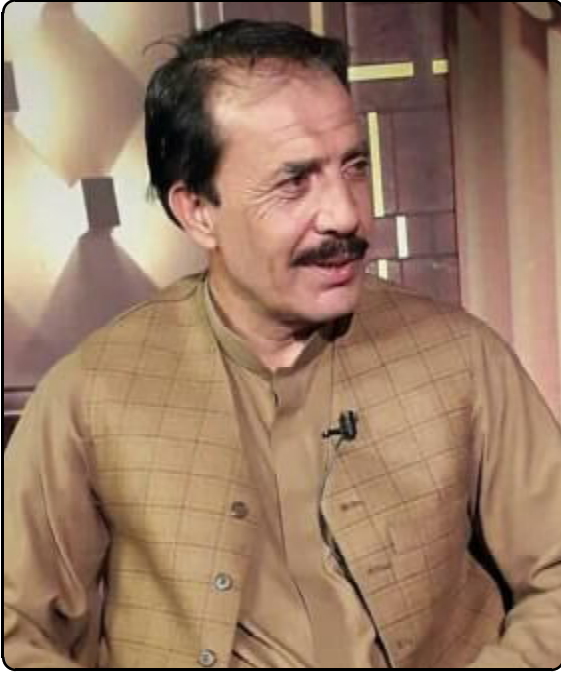
کرینے۔ یخین اٹ اونا ادبی کاریم تا آبادی نامہ و قلم اٹی برکت شاعری، او بیہرہ اسہ چکو تحریر اسے ٹی جاج ۽ ہلنگ ہندوڑ زبان و ادب نا پڑ ۽ دم و دادان مفک۔ دعا کینہ کہ خدا تعالیٰ حمید عزیز کر سا کا ہے۔