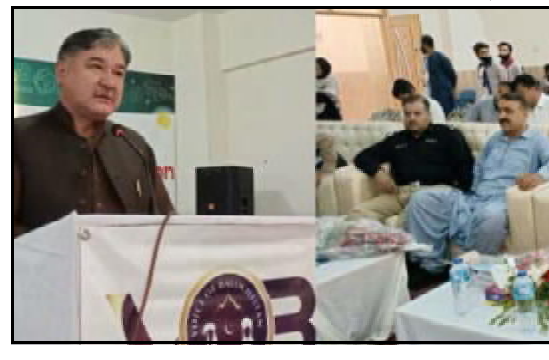
.....کوئٹہ گواڑی تا صوبائی سلا بکا عبدالخالق ہزارہ گوڈرنت شتون آباد ہائی اسکول دود آن تران کنگنگ اتی ء

لاہور (اے پی پی) صوبائی وزیر جان جوڑی پنجاب ڈاکٹر یاکین راشد تون گلہ پرائمری اینڈ سیکڈری ایملیٹیکز کراٹ اورنگ لائن میٹروپولین ڈاؤل اورڈی کرے۔ ڈاؤل ایڈیٹی ای اورنگ لائن میٹروپولین، جی ایم ایڈیٹی جیواکون، چین سوگ و ٹیٹون انٹر ٹیک اوار کرسر۔ دا وخت آ ایڈیشن سکری ڈیپنٹ غفر قواری ء ایڈیٹور آگم آن ساڑی کرسر ڈیٹی ای ای اورنگ لائن میٹروپولین صوبائی وزیر اورنگ لائن میٹروپولین 1400 ملازم تا پکسنی شین کنگنگ ات منت واری ء ہرے۔ اورنگ لائن میٹروپولین ڈیپنٹ جان جوڑی ء یات گواڑی شیلڈس ہم چن کرے۔ صوبائی وزیر جان جوڑی