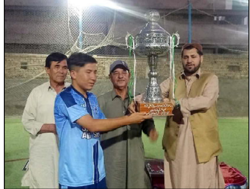
.....کوئٹہ پاکستان پوتھ چین مومنت چترین ارباب ناصر حیدر کا فرسٹ آف کونڈنا پ 32 فٹ بال ٹورنامنت تا گواڑی تے خرابی تنگنگ اتی ء