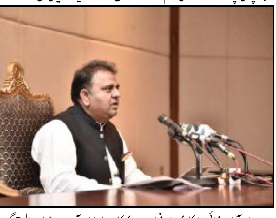
..... اسلام آباد: بجائی حواکاری وزیر فواد چوہدری کا بیٹا دیوان آن پدمیڈیا ءے حوا تنگ ءے

بجپڑ پارٹی و مسلم لیگ (ن) چنا تیا بار اسرا ایلو تون جنگ کنگ ءے، ہرا فک مسلمان ملک آتے انتہا پسندی نا ڈری خلگر ءے، او تینے اسراوار ہرر، وزیر اعظم اسلاموفیادنا دنیا نا چکار ءے کر فینے، اسلاموفیاد کی راج اٹ روید خلگنے اور وزیر پاکستانی تے وونت اناحق تنگ کن مسلم لیگ (ن) سجدہ اف، ساڑی حکومت 60 آن زیات ادارہ غا تا سرک قیادت کرے، حکومت غٹ قیادت تے