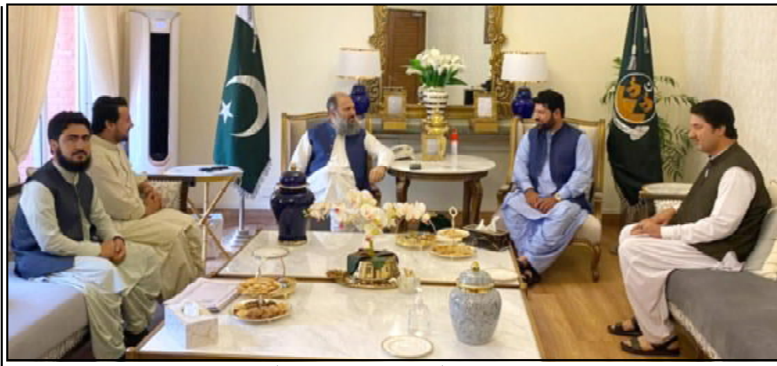
..... اسلام آباد: وزیر اعلیٰ بلوچستان جام کمال خان تون بلوچستان عوامی پارٹی نا کارندہ غا تا ڈال اس اوڈی کنگ کن ءے