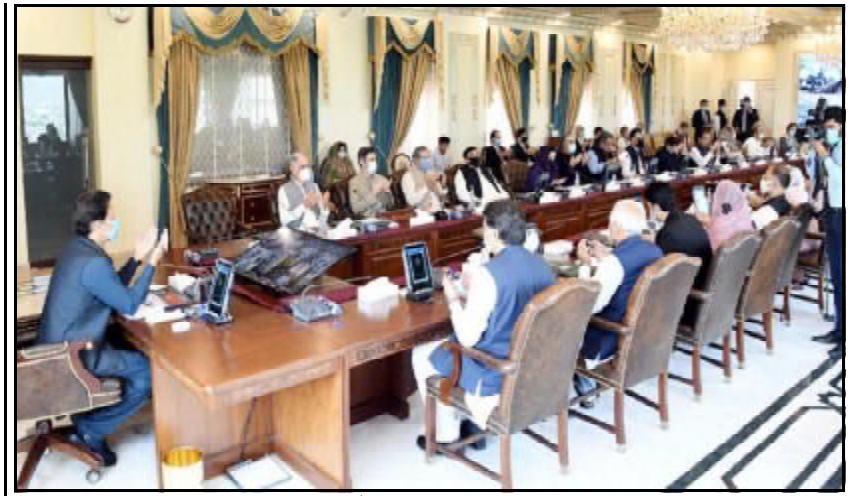
.....اسلام آباد وزیر اعظم عمران خان، پنجابی کانینٹا دیوان ناماشی ونگنگ اتی ء