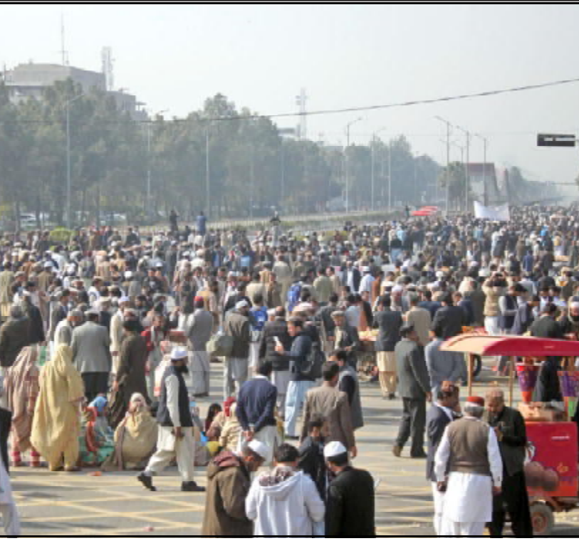
اسلام آباد ۽ سرکاری ملازم آواز گری آل پاکستان ایگزیٹو گریڈ انٹرنیشنل ٹیچنگ برانزی پیجی اڈتس