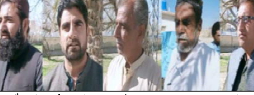
نوٹیفکیشن کابا ملازم آواز گری آل پاکستان ایگزیٹو گریڈ انٹرنیشنل ٹیچنگ برانزی پیجی اڈتس

اگ اوپن بیٹ گین کاری متو تو آرٹیکل 63 خلاف ورزی نا گمان ارے، ترجمان بلوچستان حکومت کوئٹہ (آن لائن) حکومت بلوچستان نا ترجمان لیاقت شہ پوانی پارسیے کہ بیٹ نا گین کاری سے ٹی ہارس ٹریڈنگ آج پارلیمان نا تقدس لٹا مریک باہر سے اپوزیشن اوپن بیٹ بیٹ گین کاری نا خ گھی ۽ کس آرٹیکل 63 نارواٹ اگہ کس اس پارٹی نا برخلاف وونٹ کاسٹ کرے تو اونا رکنیت معطل مریک اگہ اوپن بیٹ بیٹ گین کاری کاسٹ کرے تو آرٹیکل