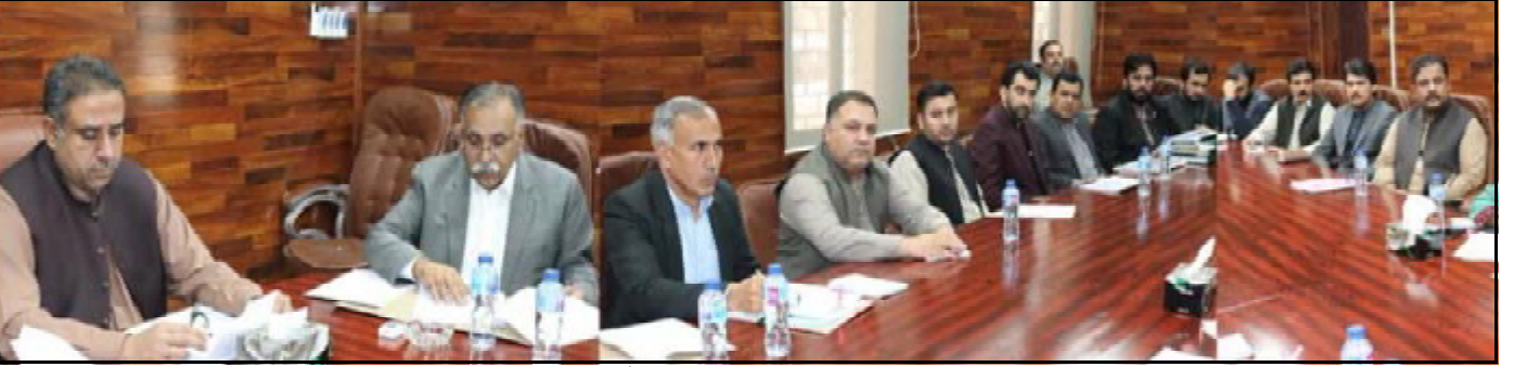
..... کوئٹہ صوبائی وزیر یو پی قلمتی سلیم احمد کورسہ جامع ہندی نا پور کنگ وچا دوات آتا ہا ت اڈبک دیوان نا کاشی ء کنگ انی ء