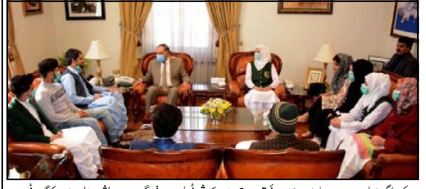
..... کوئٹہ گورنر بلوچستان امان اللہ خان یا سین زنی تون حاکمی قاسم نا کاشی ٹی بلوچستان فیگنگ ایوی ایشن نا ڈٹ اوڑدی کنگ انی ء

کابل (اے پی پی) افغانستان نا صوبہ ہلمند نا چندی علاقہ غاشی اوغان جنگی جہاز آک طالبان عسکریت پسندا تہا کنگ نا تہا