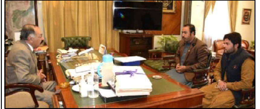
..... کوئٹہ گورنر بلوچستان امان اللہ خان یا سین زنی تون موی خیل نا محب اللہ اوڑدی کنگ انی ء