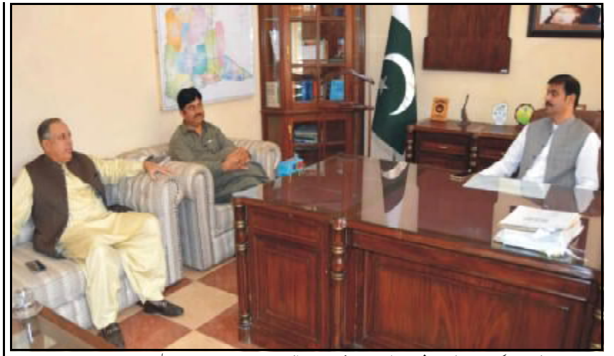
نصیر آباد کھنڈر عابد سلیم قریشی تون سکوی بجائی وزیر میر چنگیز خان بجائی اوڑدی کنگ انی ء