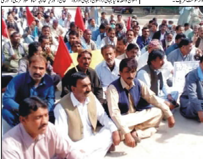
نصیر باڈ آل ملازمین اتحاد پیکان نا ڈیول صدر باوجود تینا کنڈرانی نا کاشی ٹی برانزی دھرتا تنگانے

پاکستان تینا کشمیری اہلم تاحق خود اداہیت جہد اٹھتے تون سلوک ۽، بھائی وزیر جو اٹھتے شہید کاری نا دفتر خارجہ ٹی اڈہلوک دووان تران اسلام آباد (اس پی پی) بھائی وزیر جو اٹھتے شہید کاری و شہید کاری بھائی فرار پارسیے کہ کوٹھ بھنے کہ بھائی برادری بھارتی ظلم ناٹوس ۽ دلے و کشمیری