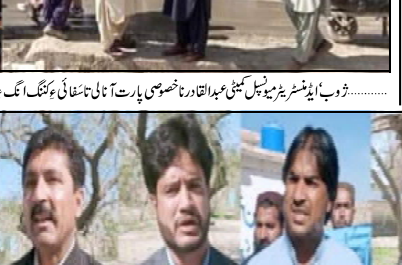
ڈوب ایڈیٹرز میونسپل کونسل اور ناظران خصوصی پارت آئی نا تاشائی ۽ کننگ انگ ۽

گورکرت تھانہ ناخوک آٹریٹنگ تنگک اسٹ اسٹیل س کوئٹہ (آن لائن) بلوچستان ناٹس بولان اسٹیل پیکل یونیورسٹی تاجا ہندار و محقق آتیان جوان راہشونی بلنگ مریک، بریفنگ دیوان آن تران