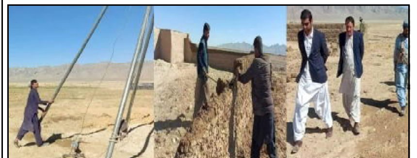
..... اورا لائی اسسٹنٹ کمشنر پوری عطا ء بلوچ تہا جوات آتا برخلاف کارروائی کنگ انی ء