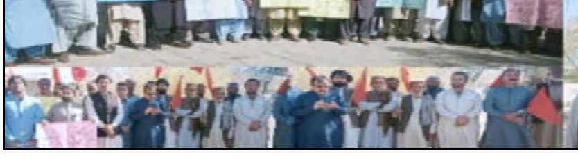
نوٹیفکیشن کابا ملازم آواز گری آل پاکستان ایگزیٹو گریڈ انٹرنیشنل ٹیچنگ برانزی پیجی اڈتس