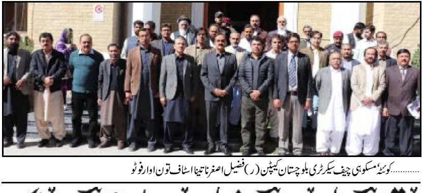
کوئٹہ سکوی چیف سیکریٹری بلوچستان کبیر (ر) فینیل اصغر تینا ایسٹاٹسٹون اور فونو

اسلام آباد ملازم آواز گری آل پاکستان ایگزیٹو گریڈ انٹرنیشنل ٹیچنگ برانزی پیجی اڈتس جزل سیکریٹری ظہور بلوچ، پیرا میڈیکل ایسوسی ایشن تاجا ہندار و محقق آتیان جوان راہشونی بلنگ مریک، بریفنگ دیوان آن تران