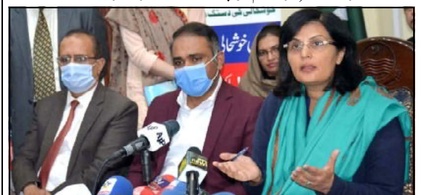
..... ناہو ژوبیر عظیم نا صومی کا کاڈا کرا نا پتہ پریس نا کنفرنس کنگ انی ء