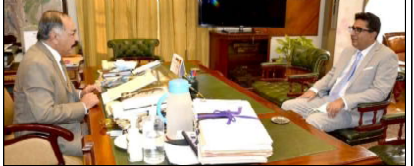
..... کوئٹہ گورنر بلوچستان امان اللہ خان یا سین زنی تون سکوی گمان صوبائی وزیر یو پی قلمتی اوڑدی کنگ انی ء

اسلام آباد (اے پی پی) عوامی جمہوری چین نا تمام مقام توصل جزل پینگ ٹیگونی یک نا رسا تھوگ اورنگ لائن ٹیگورین اٹ کاسم کرک آچینی ء پاکستانی عملہ ء چینی پوسکن انا درشانی ء کرے۔