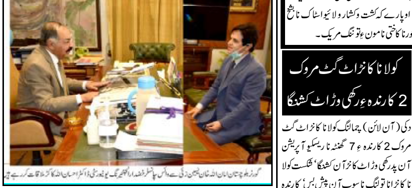
گورنر بلوچستان امان اللہ خان یاسین زئی سے اسٹیل پیکل یونیورسٹی تاجا ہندار و محقق آتیان جوان راہشونی بلنگ مریک، بریفنگ دیوان آن تران

پاک فوج پاکستان ناسر سب آرمونڈہ نامبار کابا ہندار ۽ شری رند کوئٹہ (خ ن) پارلیمانی سیکریٹری برائے اطلاعات گودی بھٹی رند تینا بیان اسٹیل پیکل یونیورسٹی تاجا ہندار و محقق آتیان جوان راہشونی بلنگ مریک، بریفنگ دیوان آن تران