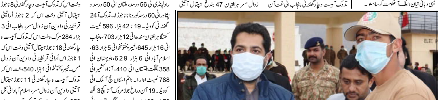
کورونا سائزنگری ٹی جلسہ کنگ ایسین ہم اخلاقی وکانوڈی وراث غلط وکل و ساء و کوروناجان بلوک و نا جوڑی سے... (Caption for the uniformed group photo.)

کورونا سائزنگری ٹی جلسہ کنگ ایسین ہم اخلاقی وکانوڈی وراث غلط وکل و ساء و کوروناجان بلوک و نا جوڑی سے... (Detailed report on the assembly session.)