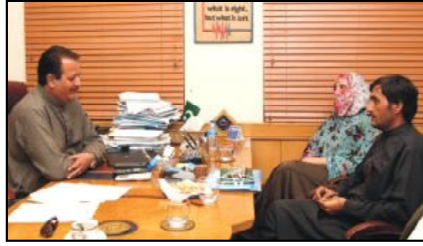
مجلس کنگ ایسین ہم اخلاقی وکانوڈی وراث غلط وکل و ساء و کوروناجان بلوک و نا جوڑی سے... (Caption for the meeting photo.)

مجلس کنگ ایسین ہم اخلاقی وکانوڈی وراث غلط وکل و ساء و کوروناجان بلوک و نا جوڑی سے... (Continuation of the report on the assembly session.)