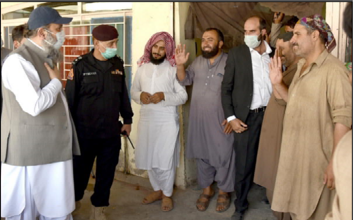
کوئٹہ وزیر اعلیٰ بلوچستان جام کمال خان سرخاب نادورہ ناوخت ءء علاقہ ناہانی تھون ہیبت وکپ کنگ انگ ءء

لسیلہ پڑی تے ٹی ایس او پی تیا عملدرآمد کر فنگ کن کوشت کنگ انگ ءء