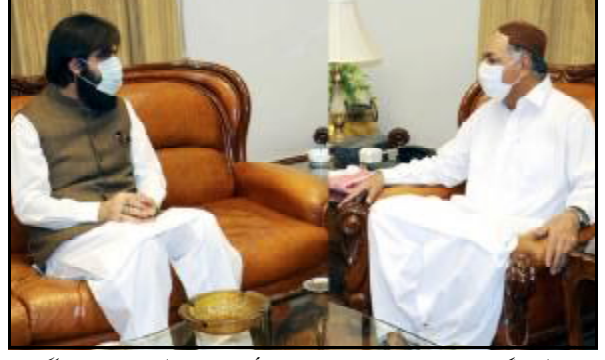
کوئٹہ گورنر بلوچستان امان اللہ خان یاسین زئی تون ڈی سی کوئٹہ سبھرا اورنگزیب باوڑی اوڑدی کنگ انگ ءء