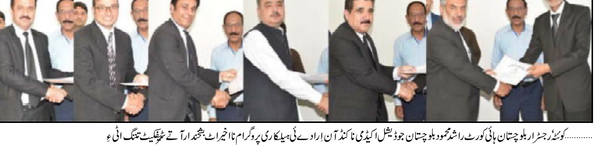
کوئٹہ رجنر اہلوچستان ہائی کورٹ راشد محمود بلوچستان جوڈیشل اکیڈمی نا کڈ آن ارادے ٹی ہیکاری پروگرام نا نا اجرات بشدرہ اتے چٹھنگ تنگ انگ ءء