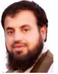
ہود ہیکو بیخ: تعلقات عامہ (iv)

ایلو فتازنداٹ نیام تمگ:- دن کہ تینا زندانا باندات آتیشی است خواہی بھاز جوان ء ہیبت سے تو ہندن ایلو فتاز زند اٹ نیام تمگ ہموش زیت خراب ء ہیبت اسے۔ اسٹ آن تعلقداری وک، ایلو فتاز تعلقدار یک خراب مریرہ۔ ایلو فتا باندات آتے پہرہ متگ نامطلب دادے کہ بندغ تینا اہلم تون ہر اتم ملے تو اونا حالیت آتے سوج کرے۔ اوٹی کڑھی درشان کے، اودے جوان ء سلاہ ایٹے، اونا جیرت ء ودنے، اگہ عملی وڑ اٹ مک کنگ کے تو اودے ہومونا سلسلہ خلع۔ دارداٹ اسراہم ء حالیت اس داہم ارے ہر اتم نئی بیان فرمائے: ”ہر اتم اسہ بندغ اس پین بندغ سے تون اہلی کرے تو اوڑان اونا پین، اونا باوہ ناپین، و اونا قبیلہ ناپین ء سوج کے۔ داسوب آن کہ اوڑتوں مہر ہیبت ناروتہ غاک سوگومریرہ۔“